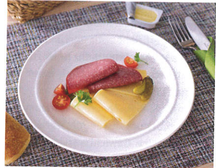
Der flache Teller gehört zum Neufchâtel-care-Geschirrkonzept von Villeroy & Boch.

Alle Geschirrteile sind aus „Premium Porcelain“ in Deutschland gefertigt. Infos: www.villeroy-boch.com