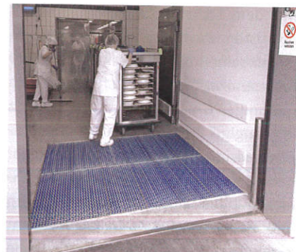
Rollwagen und Rollcontainer sind mit Profilgate einfach und schnell gereinigt.

Früher Hersteller von Schumacher-Maschinen ist die Maschinenfabrik Heute fokussiert auf Reinigungslösungen. Infos: www.profilgate.de